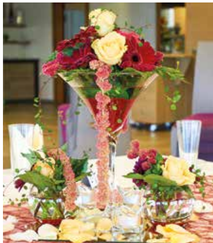
Festsaaldekoration, farblich abgestimmt auf den Brautschmuck