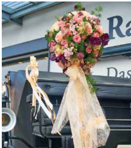
Freie Fahrt ins Glück: Dekorationen für die verschiedensten Fahrzeuge