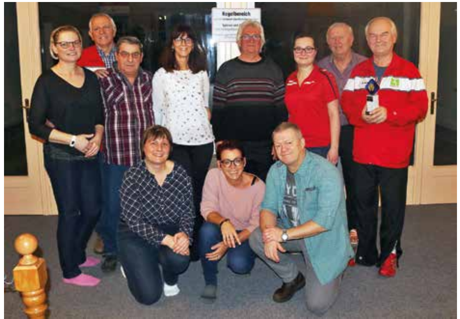
Die zweite Senioren- und die zweite Frauenmannschaft traten in einem Freundschaftsspiel gegeneinander an.

Wie auch in den vergangenen Jahren traten auch diesmal wieder zwischen Weihnachten und Silvester unsere zweite Senioren- und zweite Frauenmannschaft in einem Freundschaftsspiel gegeneinander an. Gespielt wurde mit sechs Spielern je Mannschaft über 100 Wurf. Nach dem ersten Durchgang lagen die Senioren mit 27 Kegel im Vor-