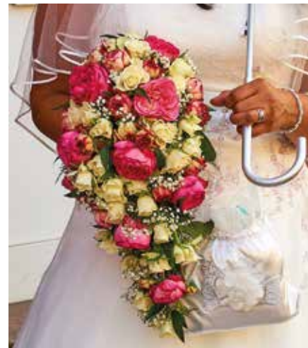
Brautstrauß in Tropfenform aus Rosen