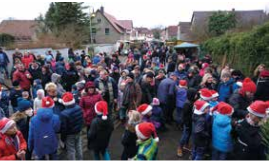
Vor der Bühne sammelten sich die Gäste und ließen sich das abwechslungsreiche Programm nicht entgehen.