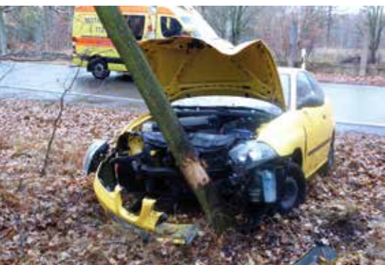
Auf der Verbindungsstraße zwischen Brandis und Zeititz rückten die Kameraden zu einem Pkw-Unfall aus.

Die letzten sieben Jahre hatte die FFW Beucha im Schnitt 22 Einsätze pro Jahr. Im vergangenen Jahr, 2018, sind es 78 gewesen. Aufgeschlüsselt nach den größten Einsatzszenarios rückten wir zu 25 ausgelösten Brandmeldeanlagen, 18 Mal zur technischen Hilfeleistung und über zehn Mal zu Einsätzen bei den Stürmen am Jahresbeginn aus. Die Feuerwehr Beucha fuhr zehn Einsätze überörtlich, das heißt zu Einsätzen außerhalb der Gemeinde Brandis. Die hohe Anzahl an Einsätzen liegt hauptsächlich an der neuen Leitstelle in Leipzig. Die alte Leitstelle