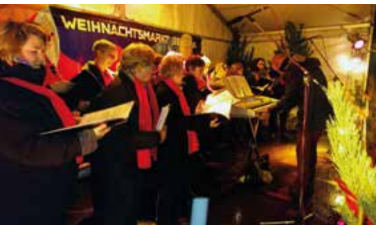
Chormusik gehört traditionell zum Beuchaer Weihnachtsmarkt.

Trotz schlechter Wetterbedingungen waren wir begeistert über die zahlreich erschienenen Besucher des Weihnachtsmarktes am Kirchberg!