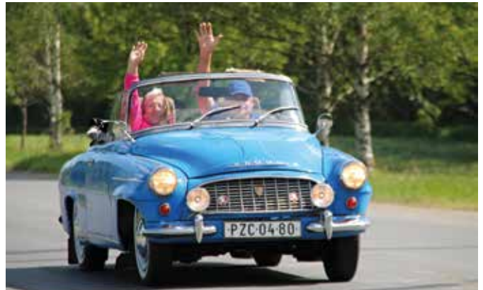
Besonders ältere Menschen sollten auf mögliche Probleme beim Autofahren achten.

Verlieren Sie beim Fahren manchmal die Orientierung? Haben Sie Schwierigkeiten, andere Verkehrsteilnehmer, Ampeln oder Verkehrszeichen zu erkennen und rechtzeitig darauf zu reagieren? Haben Sie Probleme, das Gas-, Kupplungs- oder Bremspedal zu betätigen? Hören Sie Motorengeräusche, Schaltung oder Signale anderer Verkehrsteilnehmer (manchmal) spät oder schlecht? Finden Sie es schwierig, den Kopf zu drehen und über Ihre Schulter zu blicken? Werden Sie im dichten Verkehr oder auf unbekanntem Straßen nervös? Hupen andere Autofahrer häufig wegen Ihres Fahrverhaltens? Verursachen Sie in letzter Zeit häufiger kleinere oder „Beinahe“-Unfälle? Fühlen Sie sich beim Fahren unsicher? Werden Sie schläfrig oder wird Ihnen schwindelig, nachdem Sie Ihre Medikamente eingenommen haben?