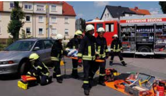
Erfolgreiche Personenrettung mit dem HLF 10 im Sommer vergangenen Jahres.

Die letzten sieben Jahre hatte die FFW Beucha im Schnitt 22 Einsätze pro Jahr. Im vergangenen Jahr, 2018, sind es 78 gewesen. Aufgeschlüsselt nach den größten Einsatzszenarios rückten wir zu 25 ausgelösten Brandmeldeanlagen, 18 Mal zur technischen Hilfeleistung und über zehn Mal zu Einsätzen bei den Stürmen am Jahresbeginn aus. Die Feuerwehr Beucha fuhr zehn Einsätze überörtlich, das heißt zu Einsätzen außerhalb der Gemeinde Brandis. Die hohe Anzahl an Einsätzen liegt hauptsächlich an der neuen Leitstelle in Leipzig. Die alte Leitstelle