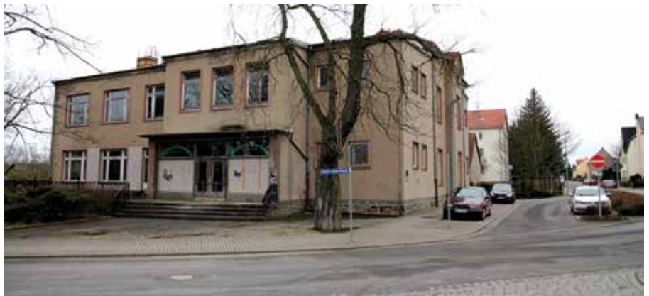
Wie die Zukunft des Kulturhauses Beucha aussehen kann, wird die Machbarkeitsstudie zeigen.

Das Kulturhaus in Beucha könnte bald zu neuem Leben erblühen. Das zumindest hat sich der Kulturhausverein auf die Fahnen geschrieben. Die Mitglieder hoffen nun auf die Ergebnisse der in Auftrag gegebenen Machbarkeitsstudie. Diese soll zum nächsten Ortschaftsratsrat, am Mittwoch, 6. Februar, 18.30 Uhr im Speiseraum der Grundschule Beucha vorgestellt werden. Darin sollen Möglichkeiten aufgezeigt werden, wie das Kulturhaus Beucha zukünftig genutzt werden kann. Es geht darum, das Entwicklungspotential und die mögliche Umsetzung einer kulturellen Umnutzung des Hauses darzulegen. Darin enthalten sein werden auch konkrete Maßnahmen einschließlich der Finanzierung und bauliche Umsetzung. In dem bereits vorliegenden Exposé zur Machbarkeitsstudie heißt es unter anderem: „Ziel ist es, das Kulturhaus als neues Zentrum für Brandis mit seinen Ortsteilen, insbesondere Beucha kulturell, touristisch und wirtschaftlich an einem infrastrukturellen Knotenpunkt gemeinsam mit weiteren geotouristischen und touristischen Akteuren zu entwickeln, sowie die Region Brandis/Beucha kulturell und touristisch zu beleben.“