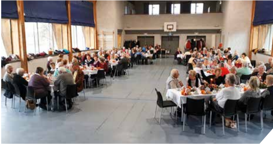
Festlich geschmückt und sehr gut besucht: Die Weihnachtsfeier der VS Brandis im CVJM.