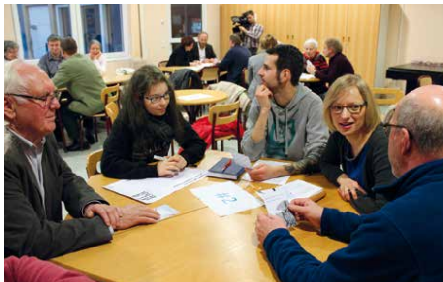
Bei einem ersten Workshop ging es unter anderem darum, was die Teilnehmer besonders an Brandis finden.