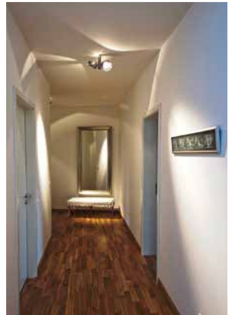
Moderne Deckenstrahler sorgen für attraktive Lichtspiele an den Wänden und betonen zugleich das Bild.