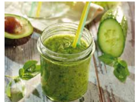
Power-Drinks: Dank ihrer Inhaltsstoffe tun „Green Smoothies“ wie dieser Avocado-Smoothie dem Körper gut.

Die Chilisauce sorgt nicht nur für Gaumenkitzel. Das in den Chilis enthaltene Capsaicin kann auch antibakteriell wirken und den Kreislauf in Schwung bringen. Wer es nicht ganz so feurig mag, würzt den Smoothie einfach mit der mildereren Tabasco Green Pepper