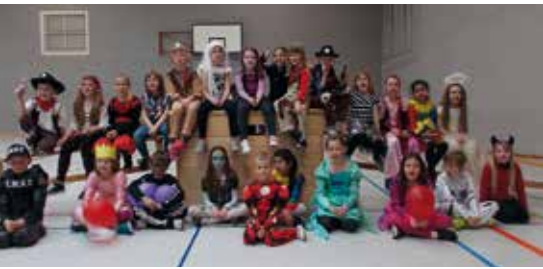
In den Ferien gehörte auch eine zünftige Faschingsfete zu den Erlebnissen im Hort.

Am 8. Februar war es endlich soweit und wir starteten in die Winterferien. Der Ferienplan war mit tollen Aktionen gefüllt. Alle Kinder freuten sich auf die kommenden zwei Wochen. In der ersten Woche drehte sich ein großer Teil der Angebote um die „tolle Tage“. In der Faschingsküche stellten wir leckere Snacks her, um uns während der Faschingsparty stärken zu können. Die Faschingsfeier am Dienstag fand in der Mehrzweckhalle statt. Dort hatten wir genügend Platz für unsere Disco und weitere lustige Spielstationen wie zum Beispiel: Dosen werfen, Schwungtuchspiele und rutschen. Von der Bäckerei Wönicker gab es sogar Donuts für diesen besonderen Tag. Am Mittwoch