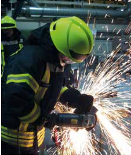
Bei der Firma Hörmann kam unter anderem der Trennschleifer bei einer Übung zum Einsatz.

Nach einem relativ turbulenten Januar wurden wir im Februar zu nur fünf Einsätzen alarmiert. Am 12. Februar galt es mit Hilfe der Drehleiter einen Baum abzutragen, der sich aufgrund von starkem Wind und Schachtarbeiten in Richtung eines Wohnhauses neigte. Am 20. und 21. Februar galt es jeweils eine Ölspur zu beseitigen. Den