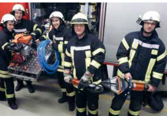
Kameraden der Beuchaer Wehr mit dem neuen Rettungsgerät.

Ende des Jahres 2015 beschaffte die Stadt Brandis für die Ortsfeuerwehr Beucha ein neues hydraulisches Rettungsgerät der Firma Holmatro. Diese Beschaffung kostete insgesamt rund 21.000 Euro. Vom Landratsamt des Landkreises Leipzig wurde die nötige Anschaffung mit 75 Prozent Fördermitteln unterstützt.