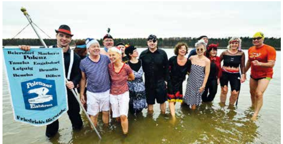
Keine Scheu vor kaltem Nass: Seit über 30 Jahren springen die Polenzer Eisbären im Winter in die Naunhofer Seen.