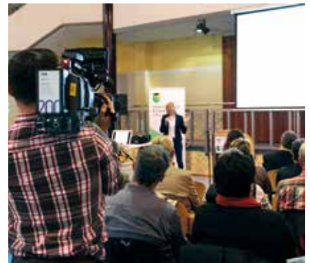
Ein Teilprojekt der Innovationskommune Sachsen ist das Erstellen eines Filmes, welchen den Werdegang zeigt. Dazu wurden auch bei dieser Veranstaltung Aufnahmen gemacht.

Im Anschluss an die Auftakt-Veranstaltung fand ein Workshop statt, zwei weitere folgten innerhalb der ersten Woche. Hier bekamen die Macher der Universität der Künste einen ersten Eindruck, wie Bürger ihre Stadt sehen, was sie unter Vernetzung verstehen oder auch, was ihnen fehlt. Da das Projekt über einen Zeitraum von einem Jahr läuft finden die nächsten Workshops in Kürze statt.