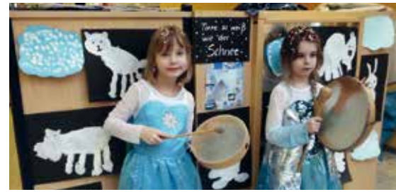
Viel Freude hatten die Kinder beim Fasching.

werden uns die Eltern der Roten Gruppe mit Handarbeiten aus Wolle unterstützen. Am 24. März hat sich der Osterhase im Kindergarten angemeldet. Während die Körbchen versteckt werden, findet für unsere Kinder eine Vorstellung des Puppentheaters André Streine statt. Erzählt wird die Geschichte vom „Burattino“. Diese Veranstaltung wird von dem Erlös des Glühweinverkaufs auf dem Wichtelmarkt finanziert. Wir haben 300 Euro dafür erhalten. Unser nächstes gemeinsames Kindergartenprojekt beinhaltet das Thema „Rund ums Essen“, wo kommt das Essen her, was ist gesund und was nicht, Farbe, Geschmack, Lieblings Speisen, was essen Tiere, was essen Menschen und noch vieles mehr. Auch in diesem Frühjahr, am 18. April, werden wir im Kindergarten wieder einen Kuchenbasar organisieren. Alle Brandiser Naschkatzen sind eingeladen – zugunsten unserer Kinder – ihre Familie oder Kollegen mit leckerem Kuchen zu versorgen.