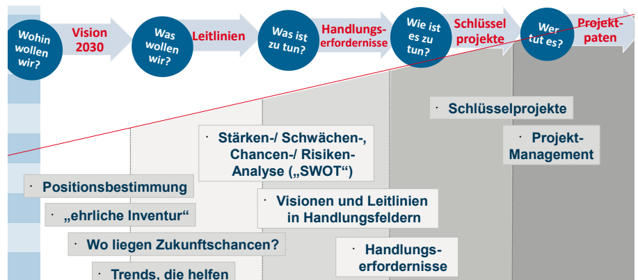
Der Weg zum Leitbild