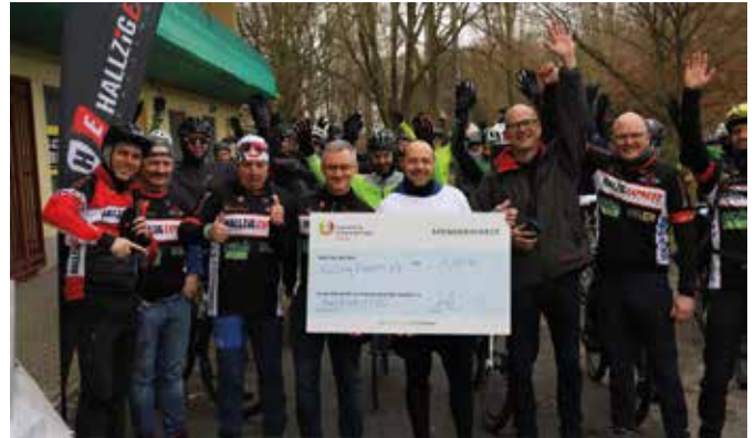
Spendenübergabe an den Elternhilfe für krebskranke Kinder Leipzig e. V.

Seit nunmehr 14 Jahren gibt es unseren Radsportverein mit Sitz im Borsdorfer Ortsteil Panitzsch. Angefangen als lose Vereinigung begeisterter Rennradfahrer aus dem Großraum Halle-Leipzig (daher der Name) haben wir uns im Laufe der Jahre zu einem ca. 70 Mitglieder starkem Verein entwickelt. Das Motto unseres Vereins lautet „CHARITYCYCLING“ – bei uns steht neben dem Radfahren die Unterstützung hilfsbedürftiger Menschen im Vordergrund, dieser Gedanke treibt uns an. Wir sammeln durch unsere Veranstaltungen, Ausfahrten und Mitglieder fortlaufend Spendengelder und unterstützen damit vor allem das Kinderhospiz Bärenherz in Markkleeberg und den Elternhilfe für krebskranke Kinder Leipzig e. V. Über 70.000 € konnten wir so schon für einen guten Zweck zusammentragen.