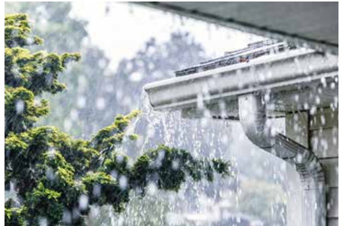
Es regnet immer zu viel oder zu wenig, ein Erdtank macht unabhängig.

Für besonders innovative Hausbesitzer ist die Aufbereitung des Dachablaufwassers zu Trinkwasser zum Beispiel mit der Aqualoop Wasseraufbereitungstechnologie eine Lösung auch in Richtung Unabhängigkeit. „Das Regenwasser wird in mehreren Reinigungsstufen aufbereitet“, erklärt der Experte, „wobei Schmutz, Bakterien und Viren ohne chemische Zusätze zuverlässig zurückgehalten