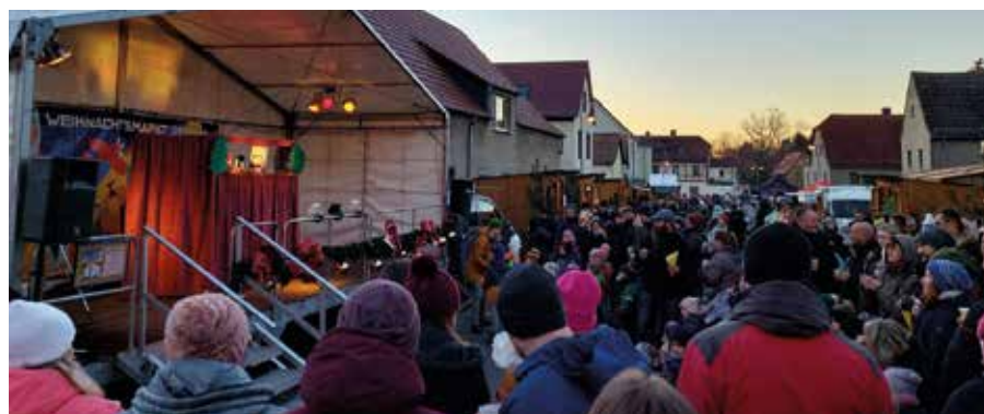
Andrang beim Puppentheater.