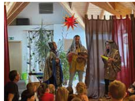
Die verkleideten Erzieher erzählten die Geschichte der Weisen aus dem Morgenland.

Um das Suchen und Finden ging es auch auf dem Naturgrundstück, denn im Winter lassen sich Tierspuren entdecken – nicht nur im Wald, sondern auch bei „Wanderungen“ durch die Felder. Welche Tiere waren hier unterwegs? Und wonach suchen die Tiere im Winter? Die Kinder konnten erfahren, was insbesondere die Vögel so alles finden können und schließlich wurde ein Futterzapfen für heimische Vögel hergestellt, die die Kinder dann auch mit nach Hause nehmen