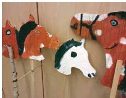
Die selbstgebastelten Steckenpferde erfreuen sich bei den Hort-Kindern großer Beliebtheit.