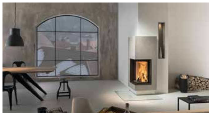
Holzfeuerstätten liegen im Trend: mit gemütlicher Wärme und attraktivem Design steigern sie spürbar die Wohn- und Lebensqualität.

Nichts vermittelt das Gefühl von Geborgenheit besser als die wohlige Wärme eines Kachelofens. Die sanfte Strahlungswärme, die von den Keramik-Kacheln ausgeht, durchdringt den Raum und schafft ein unvergleichliches Ambiente. Während es draußen ungemütlich kalt ist, entsteht drinnen ein Ort der Ruhe und eine heimelige, entspannte Atmosphäre.