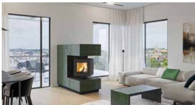
Mit echtem Holzfeuer erzeugen Kachelöfen, Heizkamine und Kaminöfen CO 2 -neutrale, natürliche Wohlfühlwärme und werten jeden Wohnraum auf.