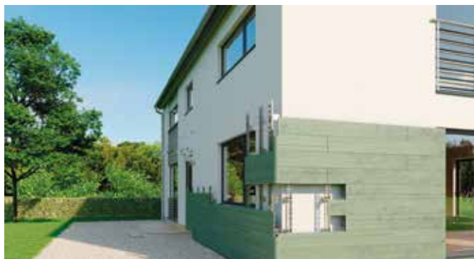
Einfach zu montieren, langlebig und ohne Pflegeaufwand: Das Holzverbundmaterial verbindet mehrere Vorteile miteinander.

Der erste Eindruck zählt – das gilt besonders für das Zuhause. Die Fassade hat neben ihrer schützenden Funktion wesentlichen Einfluss auf die optische Wirkung und Ausstrahlung eines Gebäudes. Natürliche Baustoffe wie Holz stehen bei vielen hoch im Kurs, bringen jedoch einen enormen Pflegeaufwand mit sich, damit sie dauerhaft den Einflüssen der Witterung standhalten können. Eine Alternative dazu sind moderne Verbundwerkstoffe, die aussehen wie Holz, größtenteils aus Naturfasern bestehen, aber dennoch wesentlich langlebiger und pflegeleichter sind. Zudem sind diese Fassadenelemente nach vielen Jahrzehnten der Nutzung recycelbar.