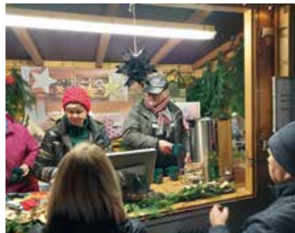
Der Heimatverein Beucha bot u.a. Kalender und Glühweintassen an.

Herzlichen Dank an die Bewohner des Kirchberges.