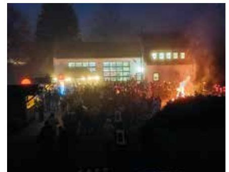
Das Neujahrsfeuer in Beucha zog so viele Gäste an wie lange nicht mehr.

Als besonderes Highlight konnten die Kameraden am 31. Januar ihre neue Einsatzkleidung in Empfang nehmen. Alle Ka-