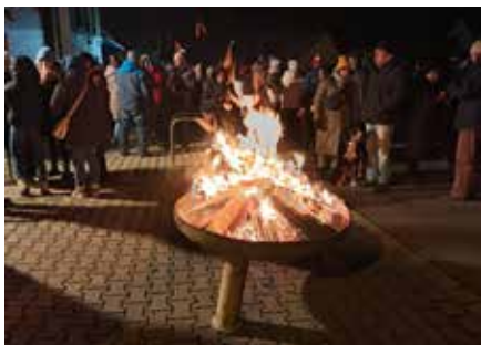
Gemütliches Zusammensein beim Neujahrsfeuer am Brandiser Gerätehaus.

Ein „besonderes Feuer“ gab es am 11. Januar an unserem Feuerwehrgerätehaus. Ge-