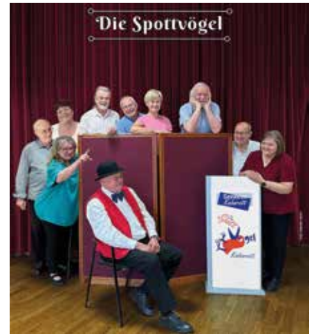
Die Spottvögel sind Ende Februar zu Gast in Brandis.

Eine Stunde Abwechslung mit den Spottvögeln aus Leipzig lohnt sich unter dem Mot-