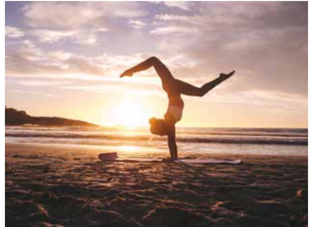
AdobeStock Jacob Lund