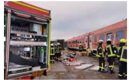
Ende Januar beschäftigten sich die Brandiser Kameraden mit der Bahnausbildung.

Praktisch waren wir am Samstag, den 25. Januar ganztägig mit einer Bahnausbildung beschäftigt. Dazu fuhren wir mit über 20 Einsatzkräften aller drei Brandiser Ortsfeuerwehren zu einer Recyclingfirma nach Espenhain. Am Anfang wurde das Verhalten im Gleisbereich und das Notfallmanagement der Deutschen Bahn erklärt. Anhand der Einsatzmerkleblätter von Schienenfahrzeugen trainierten wir das Schaffen von Notfallöffnungen bei Bahnunfällen. Auch die Brandbekämpfung bei solchen Ereignissen