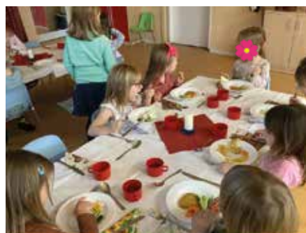
Essen wie in einem Restaurant – das gibt es in der Beuchaer Kita „FreiRaum“.

In der Kita „FreiRaum“ werden die Mahlzeiten für die Kinder zu einem ganz besonderen Erlebnis. In der liebevoll gestalteten „Schlemmerhöhle“ verwandelt sich die Essenszeit in ein aufregendes Selbstbedienungsrestaurant, das die Fantasie der Kinder anregt und ihnen gleichzeitig wichtige soziale Fähigkeiten und Werte vermittelt sowie die Selbstständigkeit fördert.