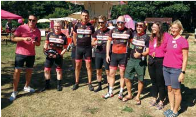
Spendenübergabe an das Kinderhospiz Bärenherz