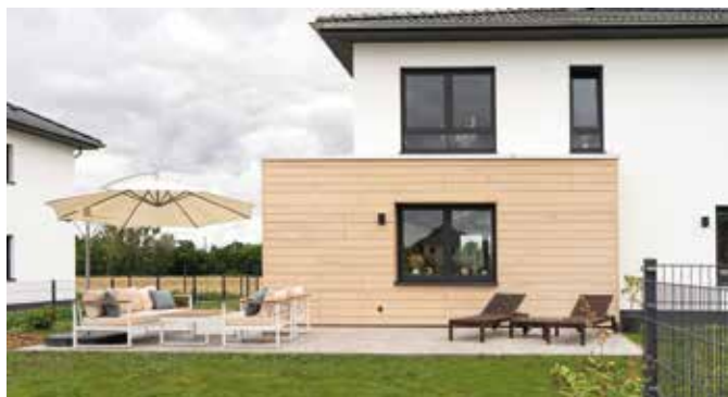
Fassaden schützen und schmücken das Zuhause gleichermaßen. Für ein naturnahes Bauen eignen sich moderne Holzverbundwerkstoffe.